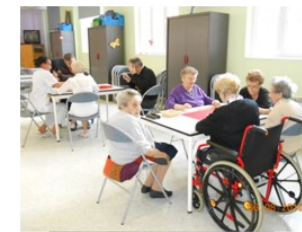
ACTIVITÉS EN SALLE D'ANIMATION

Ce projet d'animation évoluera ainsi que les autres en fonction des besoins et des demandes de la population accueillie.